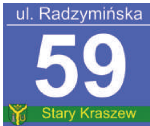
Wzór tabliczki adresowej w Gminie Klembów

Czas oczekiwania na tabliczkę wynosi do 10 dni. Poinformujemy zamawiającego o możliwości odebrania tabliczki z Urzędu Gminy.