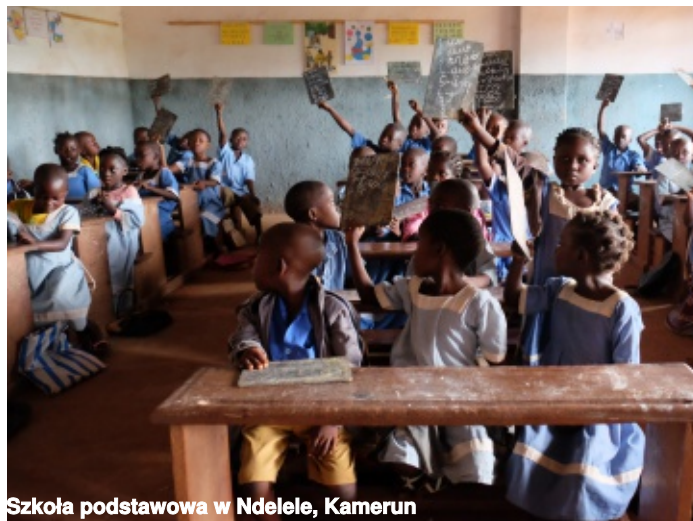
Szkoła podstawowa w Ndelele, Kamerun

Czy kiedykolwiek zastanawiali się Państwo nad tym jak wygląda szkolnictwo w krajach Trzeciego Świata? Jak bardzo odmienne są warunki edukacji dzieci z Polski i dzieci z Afryki? Przekonali się o tym uczniowie ze Szkoły Podstawowej im. Jana III Sobieskiego w Woli Rasztowskiej, którzy wzięli udział w programie „Adopcja Serca”.