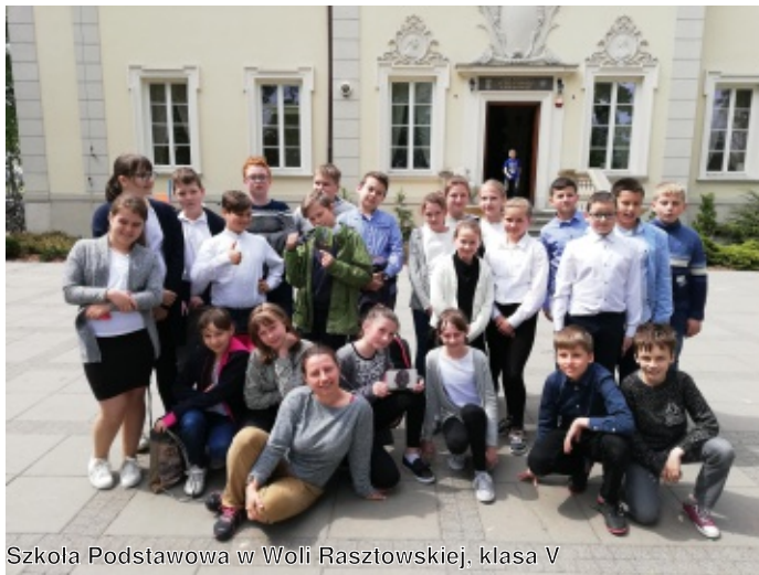
Szkoła Podstawowa w Woli Rasztowskiej, klasa V

- Dla nas są to niewielkie kwoty, w szczególności jeśli przeliczy się je na jedno dziecko w klasie - wychodzi po około 2,20 zł miesięcznie. Jednak dla dzieci Trzeciego Świata jest to coś naprawdę wielkiego: szansa na codzienny ciepły posiłek,