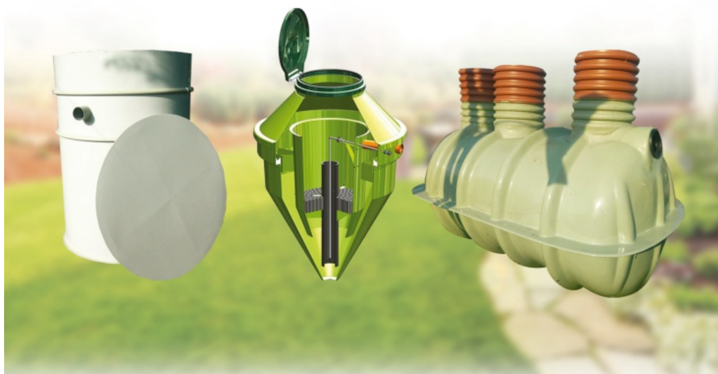
OSZCZYSZCZALNIA BIOLOGICZNA NV (do 30 RLM)