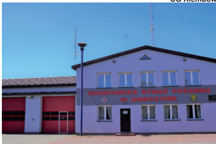
Ochocka Straż Pożarna w Dobczynie