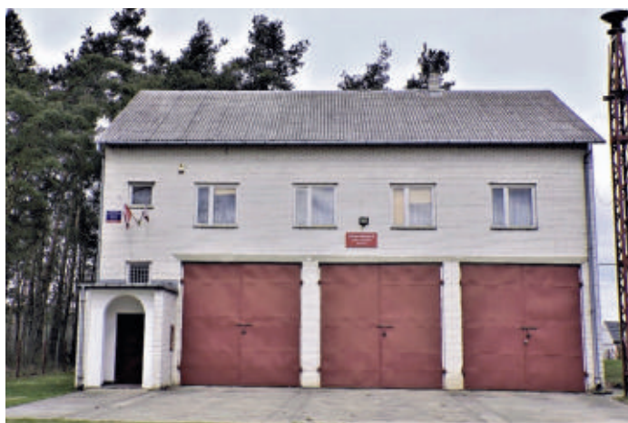
Ochocka Straż Pożarna w Kruszu