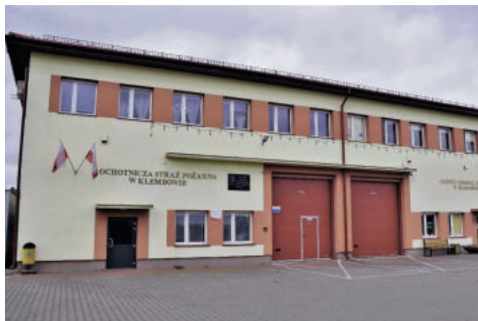
Ochocka Straż Pożarna w Klembowie