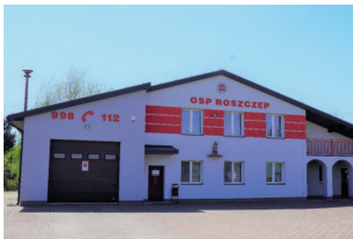
Ochocka Straż Pożarna w Roszczepie